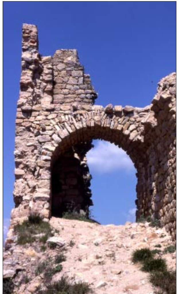
Castell de Palafolls l'any 1978.

L'emplaçament, amb els acusats desnivells de la muntanya, determina aquesta irregularitat, amb un desequilibri manifest en les masses de construcció, ja que les més fortes i destacades han d'agrupar-se al cim que s'alça a l'extrem meridional de la muntanya, mentre el recinte exterior es prolonga fins al nord per cobrir tota la longitud de l'allargat planell. Així