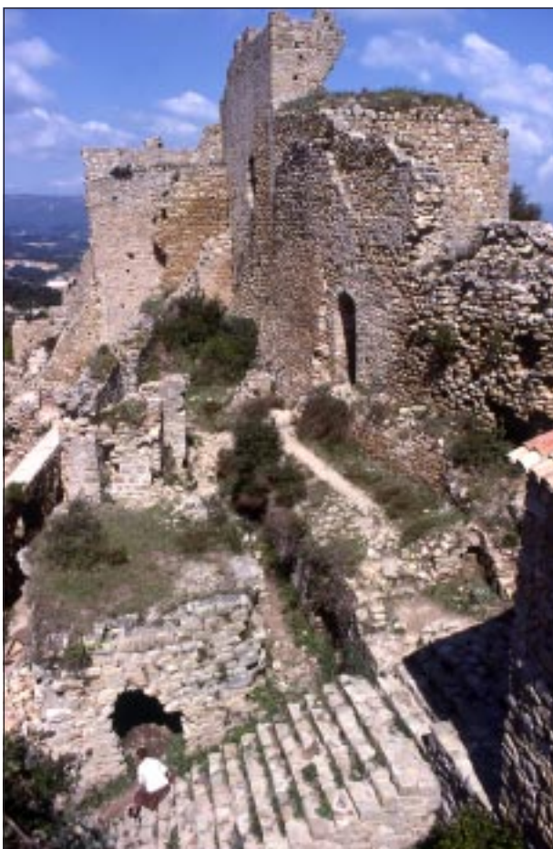
Interior del castell de Palafolls l'any 1978.

Junt a aquesta torre i mirant a llevant, hi ha un portell de sortida amb vestigis d'una escala. L'interior d'aquest primer recinte formaria una plaça llarga i més aviat estreta, que després es prolonga en un altre espai obert i en declivi davant la porta principal del segon.