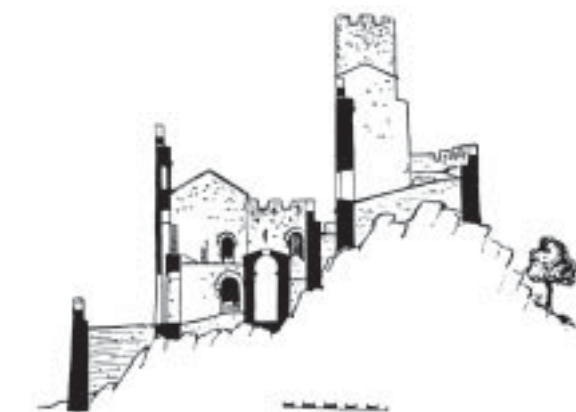
Croquis extrets d'Els Castells Catalans