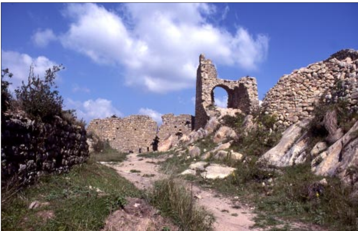
Interior del castell de Palafolls l'any 1978.

resulta en conjunt una planta aproximadament rectangular (amb molts accidents en el seu perímetre), dins de la qual s'acumulen els edificis residencials a la meitat meridional i més enlairada.