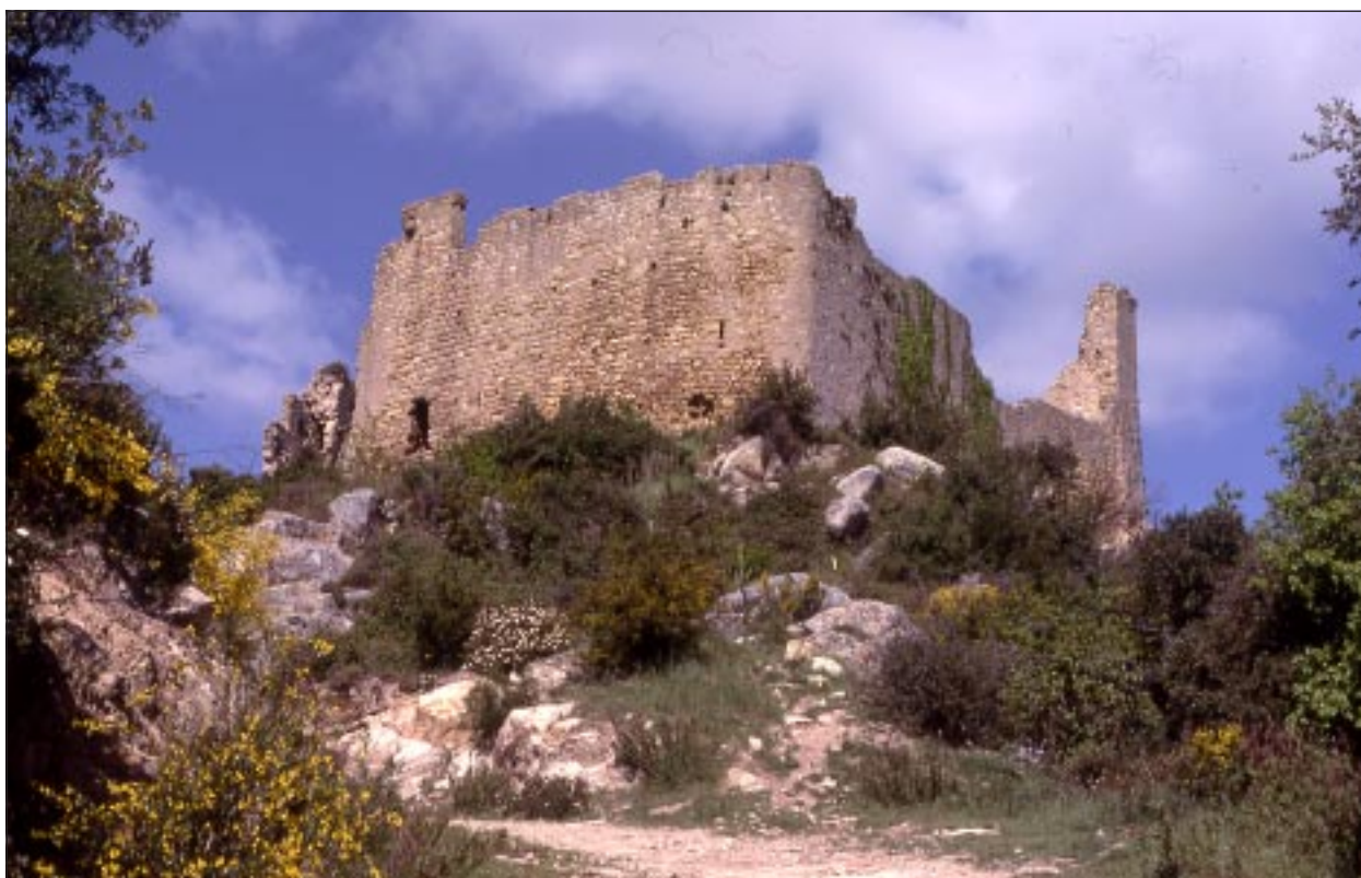
Castell de Palafolls.