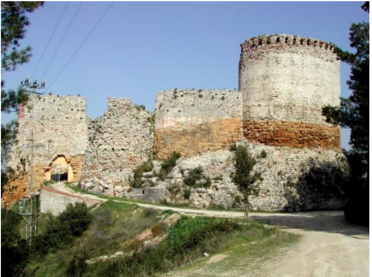
Muralles est del castell.

es troba constituït per les calcàries i dolomies del Muschelkalk Superior (Triàsic).