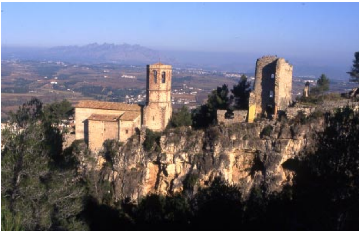
Vessant sud del castell amb l'església.

Entre 1070 i 1086 el noble prelat Umbert