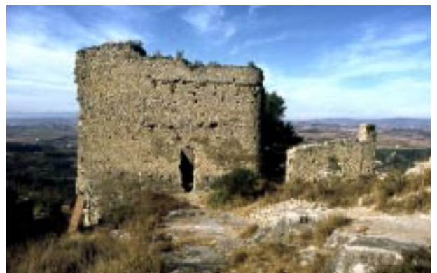
Interior del clos del castell.

Al peu del castell, i poc més amunt, podem contemplar dos exemples d'aprofitament de les roques: una antiga pedrera i la fàbrica del Cement. Aquesta va estar en funcionament durant els primers anys del segle actual.