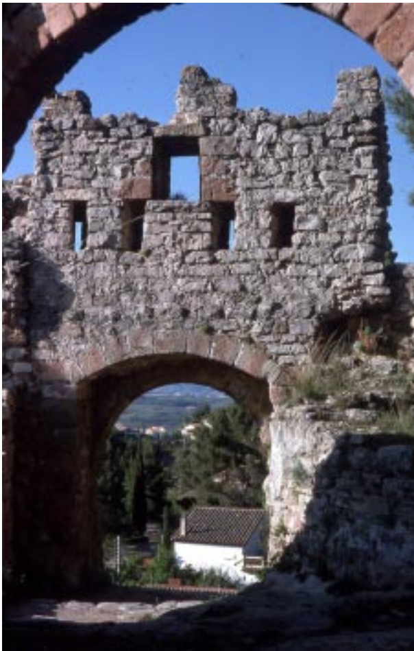
Portal d'entrada al castell.