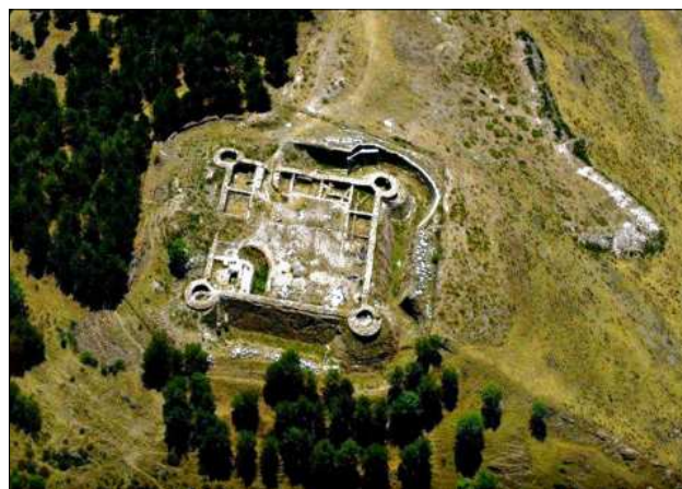
Vista aèria del castell.

El castell de Llívia ocupa el cim de la Muntanya del Castell, turó isolat des del qual es controla el conjunt de la plana cerdana, amb un gran valor estratègic. Al costat intern de l'actual cantonada sud-oest del castell, s'han localitzat un conjunt d'estructures d'hàbitat molt senzilles, del voltant dels segles XI i XII, que es devien relacionar amb una petita fortificació situada una mica més al nord. Aquesta devia ser un castell roquer,