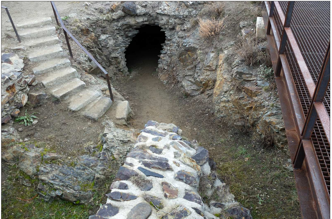
Murs de l'interior del castell.

ria de Montpeller i les Illes Balears (1279-1349). En aquest moment, s'implanta un nou tipus de fortificacions lligades a l'art gòtic. Els castells passen a ser més grans, amb una planta regular organitzada a l'entorn d'un pati central. El castell de Llívia és un dels exemples més destacats d'aquesta tipologia de castell.