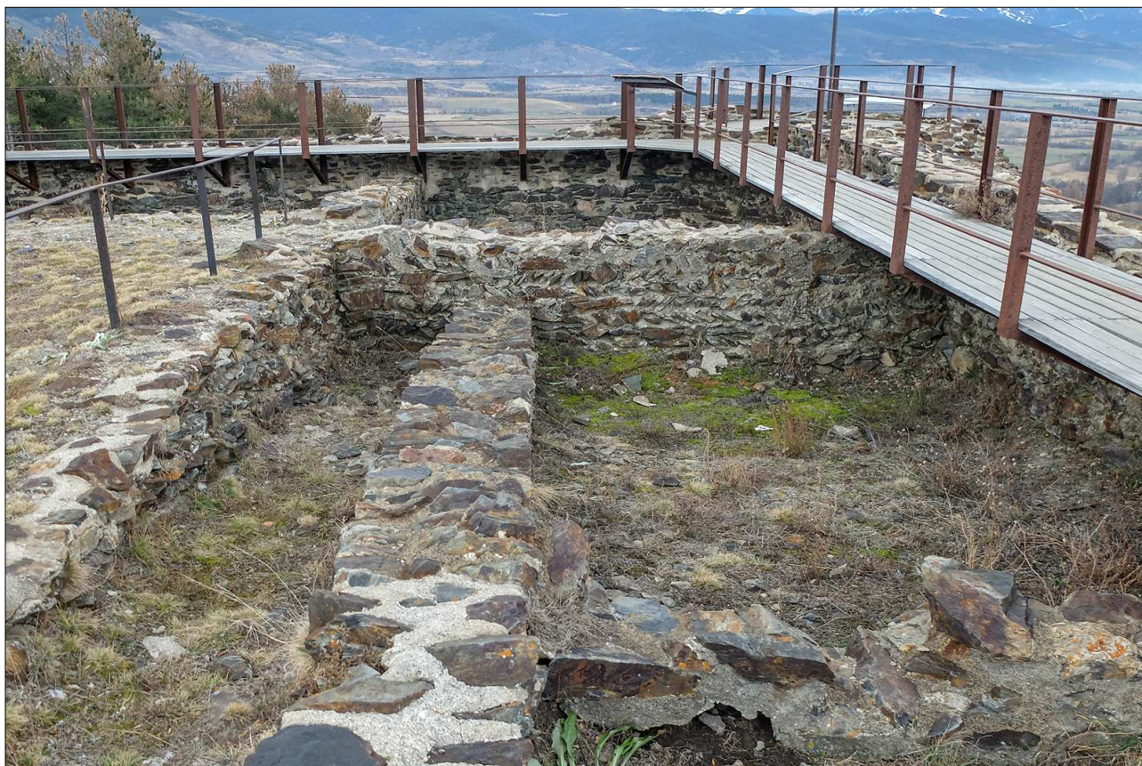
Murs de l'interior del castell.

elevat del puig, de planta quadrangular, d'uns 35 metres de costat, 1,5 de gruix de mur i un perímetre de 140 m. Als vèrtexs, 4 torres circulars de 4 m de diàmetre intern. Envoltada per un profund fossat excavat a la roca, s'estructurava al voltant d'un pati central sota del qual hi havia una gran cisterna de planta rectangular i coberta de volta, excavada a la roca, amb les parets internes recobertes de morter hidràulic. Les mides són d'11 metres de llargada per 5 d'amplada i una alçària aproximada de 4 m. La torre de l'homenatge (angle nord-est) comptava amb el seu propi fossat, la seva pròpia cisterna, coberta amb volta de canó i un pont que travessava el fossat del castell i li donava un accés propi des de l'exterior. D'aquesta manera, la torre funcionava com una mena de reducte defensiu aïllat.