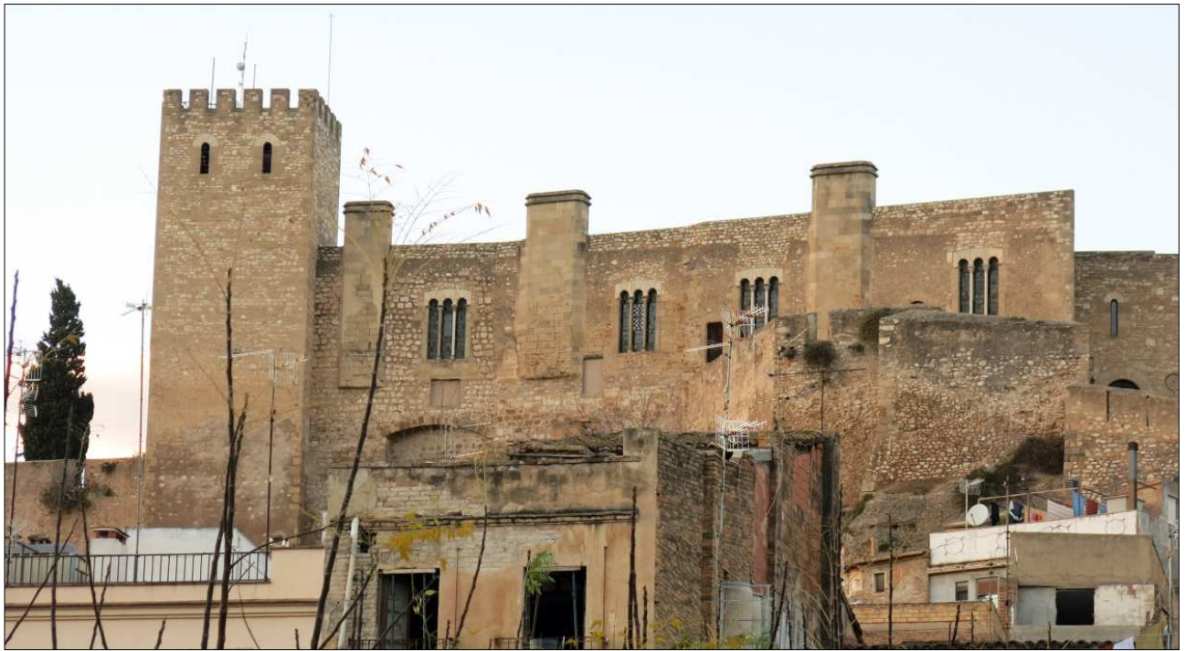
La Suda des de la plaça de Mossèn Sol.