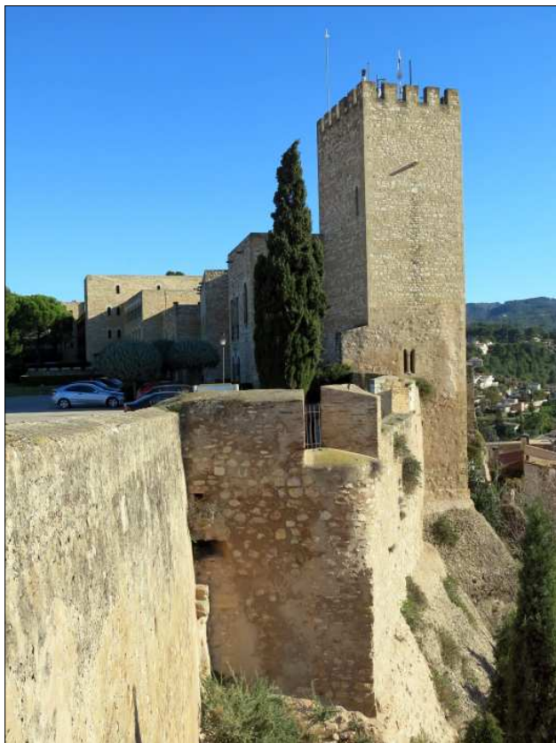
Torre mestra des de la torre Túbal.

precisar el conjunt constructiu anterior al segle XIV. Aquest text es refereix al període romànic, al nucli originari, identificat on avui es troba el parador nacional de turisme.