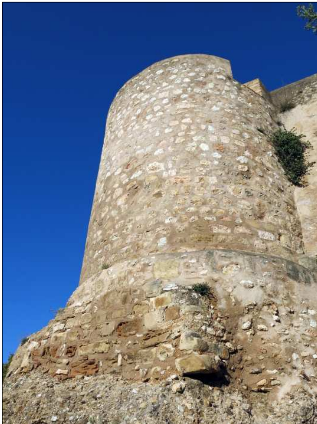
Torre de Túbal.

Ja en el sector est hi ha la torre 8 , de planta quadrada, angles no carreuats i tot el parament amb pedres no treballades, disposades en fileres. De la torre 9 només en resta la part inferior, assentada sobre el conglomerat, reforçat per una cobertura de maçoneria que simula una base atalussada.