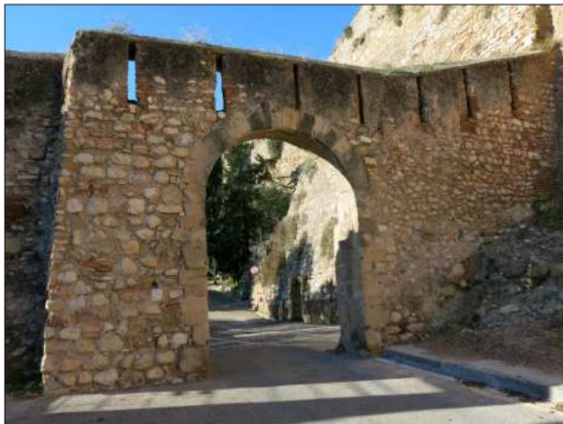
Portal recinte mitjà.

del sector nord hi ha una gran quantitat de carreus reaprofitats i algunes fileres en disposició d' opus spicatum . És documentada l'existència de làpides distribuïdes de forma dispersa com a elements constructius per diferents parts del castell.