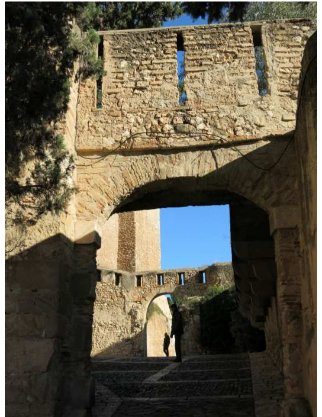
Portal recinte inferior.

Pel que respecta als trams emmurallats, coexisteixen paraments diferents de maçoneria i sovint s'intercalen fragments refets, testimoni de les guerres. A la base del tancament del contrafort