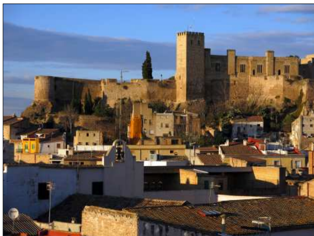
La Suda i La Puríssima des del mirador de Sant Tomàs de Santa Clara.

Nom del castell: La Suda Data de construcció: X Municipi: Tortosa Comarca: Baix Ebre Altitud: 49 m Coordenades: E 0.523453 N 40.814973 (Geogràfica - ETRS89) Com arribar-hi: situat al mig del nucli urbà de Tortosa.