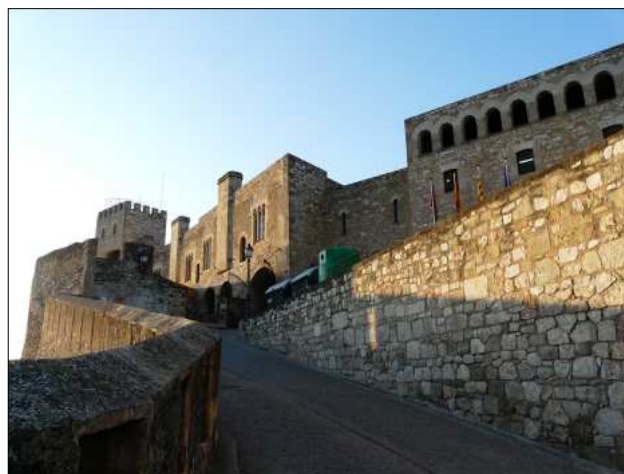
Pujada al castell.

A partir de la torre 6 , el recinte es desvia a l'interior i, igual que la torre 7 , guarda l'aspecte comú, si bé amb remodelacions importants, d'èpoques posteriors. El sector nord no té res a veure amb la fisonomia descrita fins aquí. La fortificació és més massissa, sense torres i correspon a la cons-