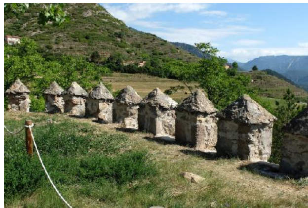
Merlets a la zona superior.

Es tracta d'un castell medieval situat sobre el nucli antic de l'actual ciutat de Berga, dalt d'un turó defensat de forma natural per una riera al nord i un desnivell pronunciat al sud. En un document conservat del segle XVIII es critica el mal estat del castell i el qualifica de ruïnós i inadequat per a la defensa de la població. El 1928 fou venut a