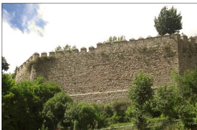
Castell en l'actualitat.

Nom del castell: Berga Data de construcció: XI Municipi: Berga Comarca: Berguedà Altitud: 805 m Coordenades: E 1.846670 N 42.106633 (Geogràfica - ETRS89) Com arribar-hi: situat a la part alta de la ciutat de Berga i arran de la carretera que va a Sant Llorenç de Morunys. Ben visible des de la ciutat.