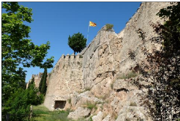
Castell actual.