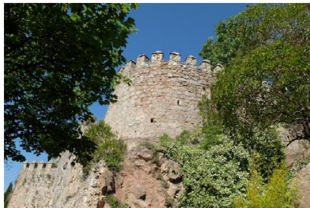
Castell actual.

un particular; en aquest moment encara conservava tota l'estructura i les principals edificacions, però l'any 1940 fou transformat en una zona residencial i turística, essent objecte d'una intensa remodelació que va destruir gran part de la seva estructura arquitectònica original. En l'actualitat només resten uns trossos de mur —de 9 m de longitud, 2 m d'alçada i 0,5 m de gruix— en un dels punts més elevats de la fortalesa, en l'indret anomenat Bonete: es tracta de murs caracteritzats per un aparell força irregular format per pedres poc treballades a excepció de les cantoneres, on es conserven uns carreus ben escairats. Alguns obrers que treballaren en la remodelació recorden l'existència de tombes al lloc on actualment hi ha la piscina. El parament és a base de pedres de diverses mides disposades en filades i unides amb morter.