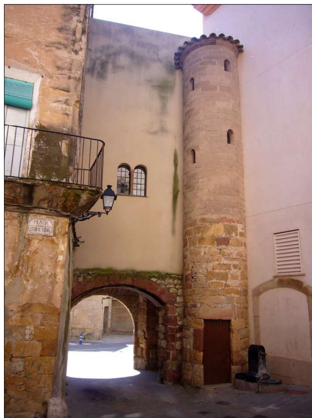
Portal de la Saura.

A primers de setembre del 2010 es van encetar les obres de restauració de la torre de Ca Tatxó, edifici de propietat municipal catalogat com a Bé Cultural d'Interès Nacional. Situat dins del nucli antic del poble, la torre és una construcció del s.XVII.