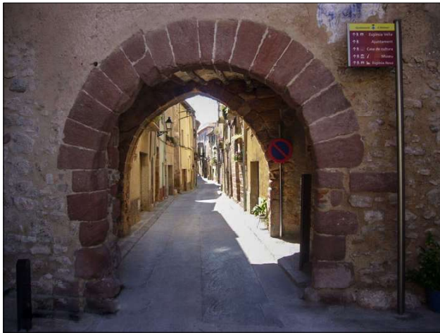
Portal de Sant Miquel.

pogués tirar la caldera d'aigua i d'oli bullents. En l'actualitat, la morfologia de les torres és molt diferent de la que presentarien en el seu origen, ja que han estat adaptades a les necessitats d'habitatge dels veïns.