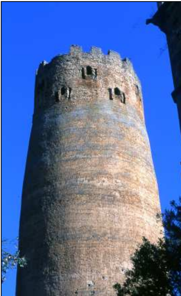
Torre de Vallferosa.

Per si l'exposat fos poc, la de Vallferosa és una torre que té unes particularitats que la fan única i singular: de ben segur que la Torre de Vallferosa és l'única edificació que resta en peu des del primer mil·lenni, amb unes dimensions i característiques similars (conserve gairebé tota la seva estructura i té molta alçada: 30-33 m, en relació als anys i poca base). La seva situació, mig amagada i enclavada a la vall l'han protegida de molts llamps, malfactors i turbulències.