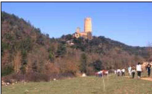
Torre de Vallferosa. Foto feta el 1997 per Jordi Gironès