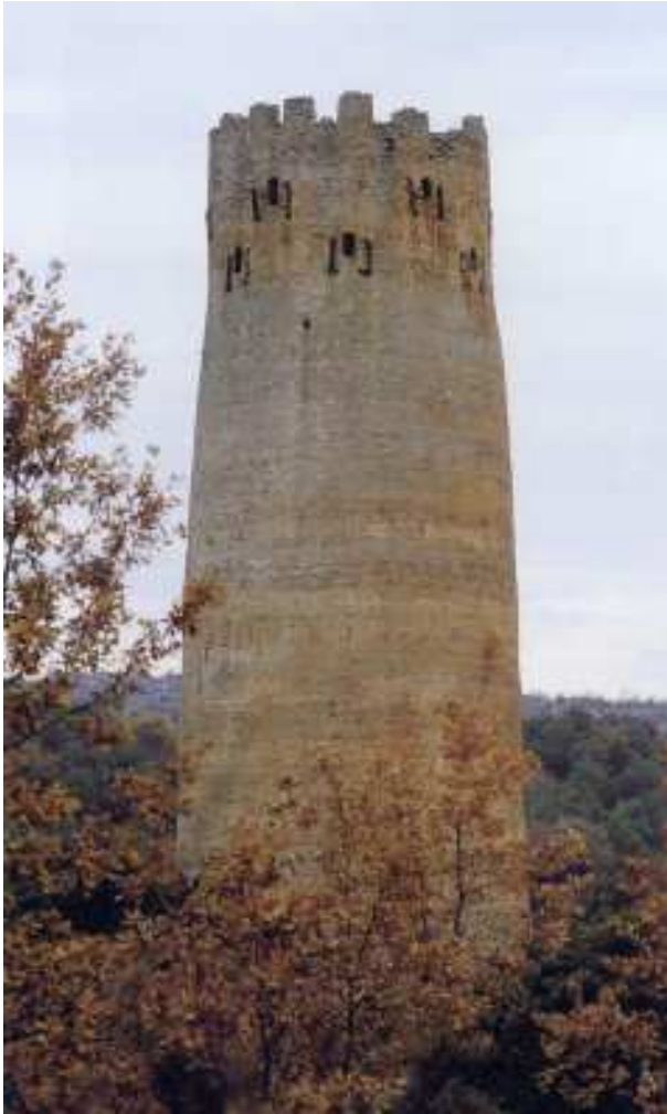
Torre de Vallferosa. Foto feta el 1997 per Jordi Gironès

forçosament ho hem de fer de la Torre; ja que a part de ser única, està considerada l'obra mestre de l'arquitectura militar europea del segle X.