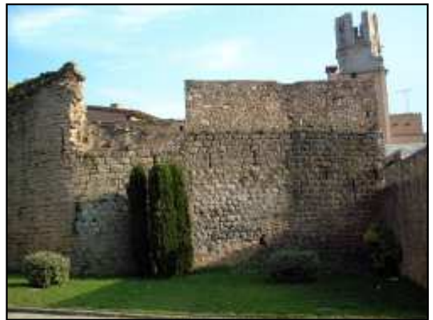
Muralls de Torroella