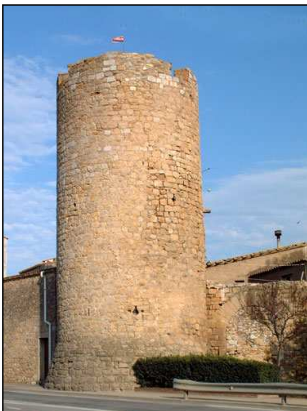
Torre de les Bruixes