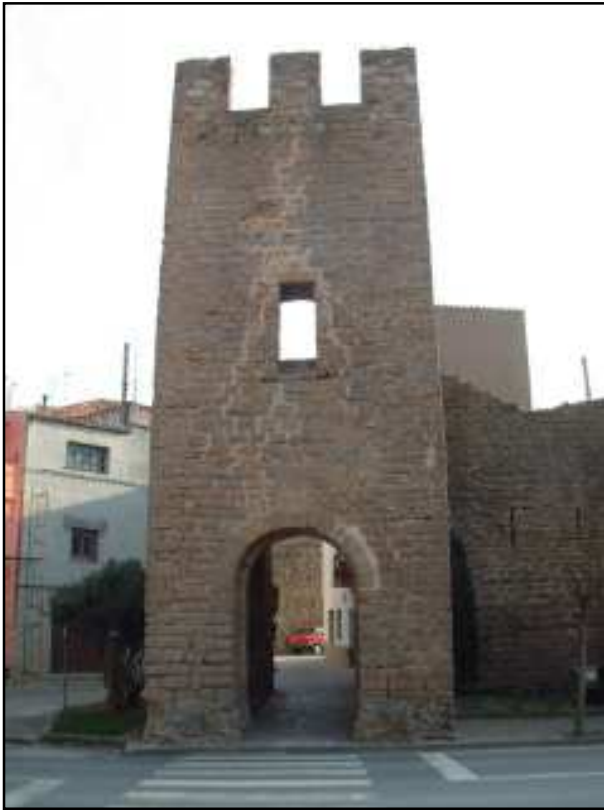
Torre de Santa Caterina

(perdent la o). Un altre familiar d'aquesta família fou Guillem de Montgrí, sagristà de Girona i germà de Bernat, qui organitzà l'expedició destinada a la conquesta d'Eivissa (1235).