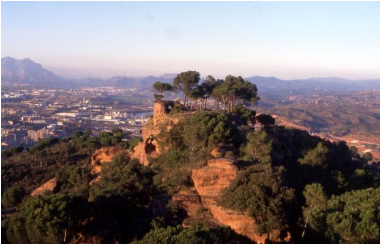
El castell vist des del serrat que l'uneix amb el castell de Castellvell.

estat hostil al rei Joan II, fou confiada a Roger de Rosanes.