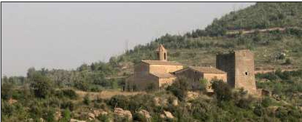
Conjunt del castell i església de Riner