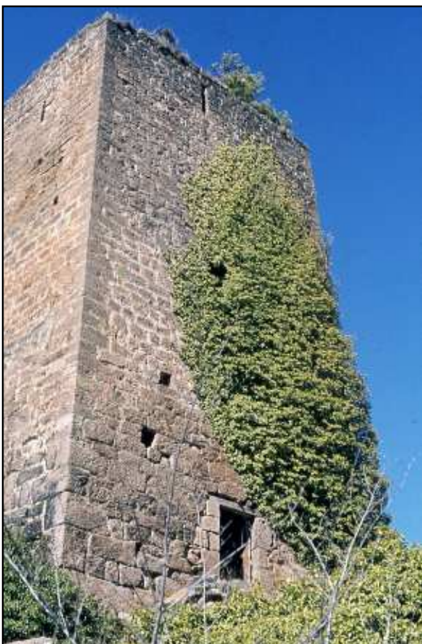
Torre de Riner. Foto feta l'any 1980 per Jordi Gironès

ta a l'interior, on hi ha una nau coberta amb volta apuntada.