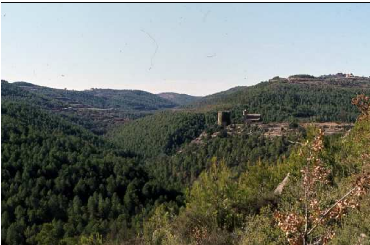
Castell de Riner.

Nota: extret del volum Urgell de de la Catalunya Romànica d'Editorial Pòrtic, junt de 2001 Jordi Gironès Vilardebò octubre de 2008