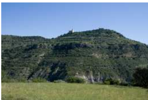
Castell de Mur amb l'església de Santa Maria a la seva dreta. Fotografia feta des de migjorn per Jordi Gironès.

Nom del castell: Mur Data de construcció: segle X Municipi: Castell de Mur Comarca: Pallars Jussà Altitud: 890 m Coordenades: E 322869.5, N 4663865.5 (ED50 UTM 31N) Longitud: 0° 51' 23.72" Latitud: 42° 6' 18.14" (ETRS89 Geodèsiques) Com arribar-hi: s'hi accedeix des del poble de Guàrdia de Tremp mitjançant una carretera asfaltada no massa ampla.