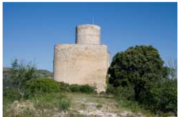
Façana est del castell de Mur.

La torre cilíndrica presenta dues portes situades en nivells diferents, les quals devien respondre als diferents nivells de les estructures interiors. El perímetre del castell té, a més de les finestres de la torre oest, unes espitlleres allargades i unes altres obertures, a la part baixa dels murs, que semblen fetes per a abocar-hi líquids i probablement tenien caràcter defensiu.