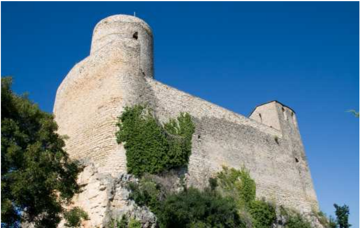
Façana nord del castell de Mur.

El castell i la canònica formen un interessant conjunt, consolidat i estudiat gràcies a successives campanyes de restauració iniciades al primer terç del s. XX i també en la dècada dels setanta i els vuitanta.