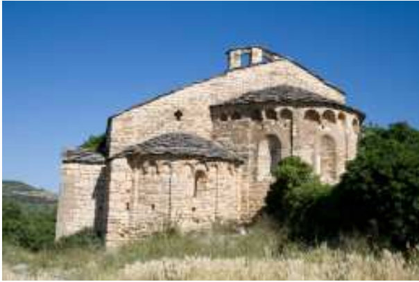
Absis de l'església de Santa Maria de Mur.

Els murs no tenen decoració, a excepció de la façana absidal, on veiem arcuacions llombardes sota el ràfec que es distribueixen de tres en tres entre lesenes. Completen l'aspecte exterior de la capçalera tres finestres de doble esqueixada a l'absis central, i una a l'absidiola.