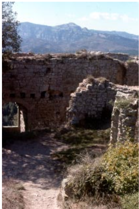
Interior del castell (1976).