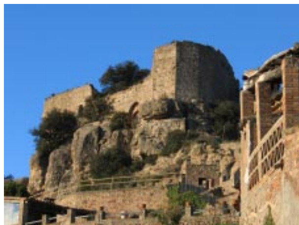
Façana sud del castell.

El castell de «Graneira» surt aludit en una escriptura signada l'any 1160 per Berenguer Reverter qui encomanà el castell a Arnau de Montserrat (castlà). L'any 1187 Berenguer de Guàrdia (o de la Guàrdia) assignà, per testament, el castell montserratí de la Guàrdia i el d'Apiera (Piera) —els quals tenia en feu del monarca— a Arbert de Castellvell, deixant-li ensem els castells de Granera, Castelltort i