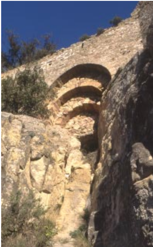
Portal façana sud (1994)