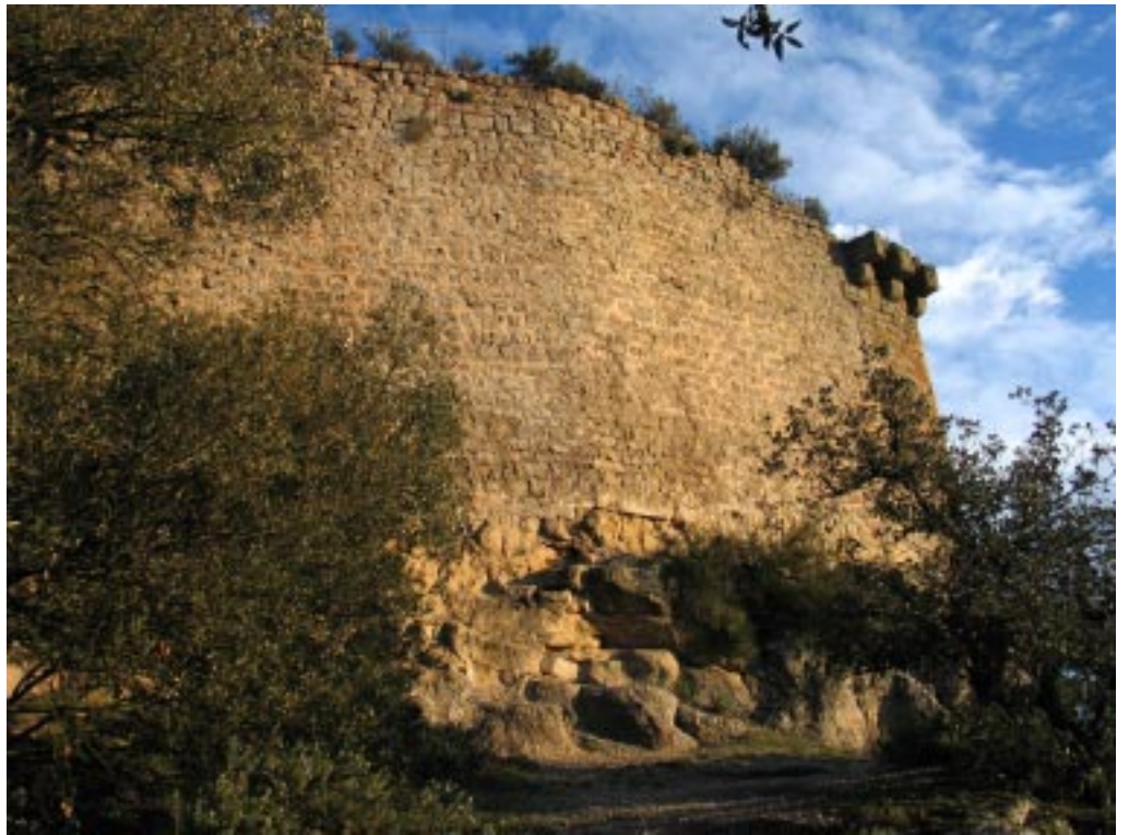
Mur de la façana oest.

Castellnou de Bages, confiats a Bernat de Belllloc, de la Roca.