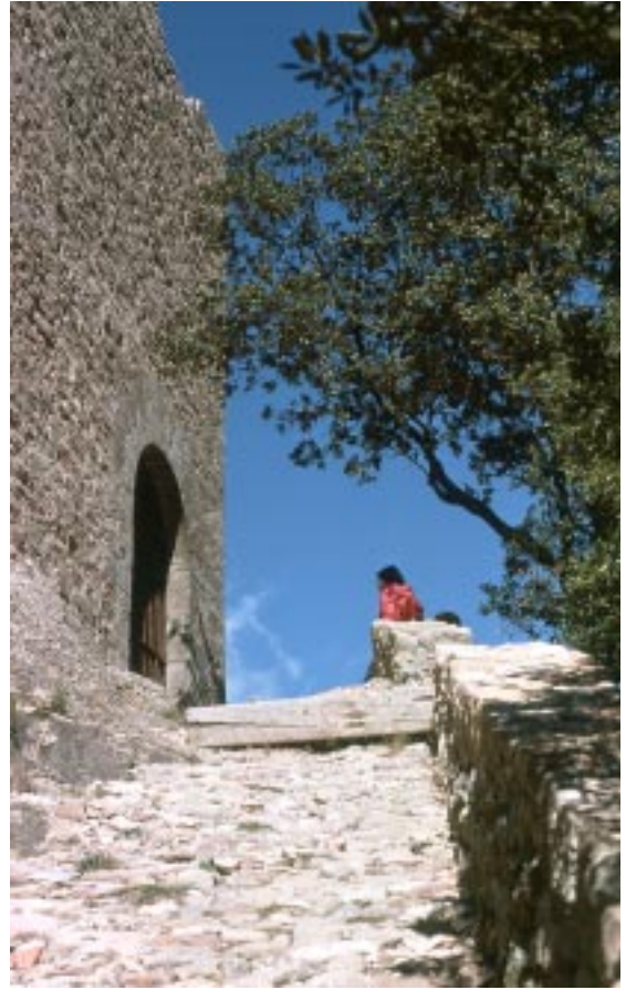
Escala d'accés (1976).