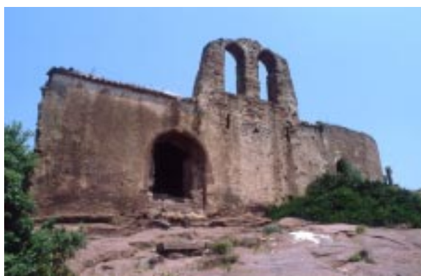
Sant Miquel d'Eramprunyà