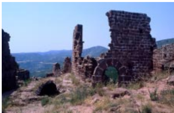
Murs i sòtans del castell