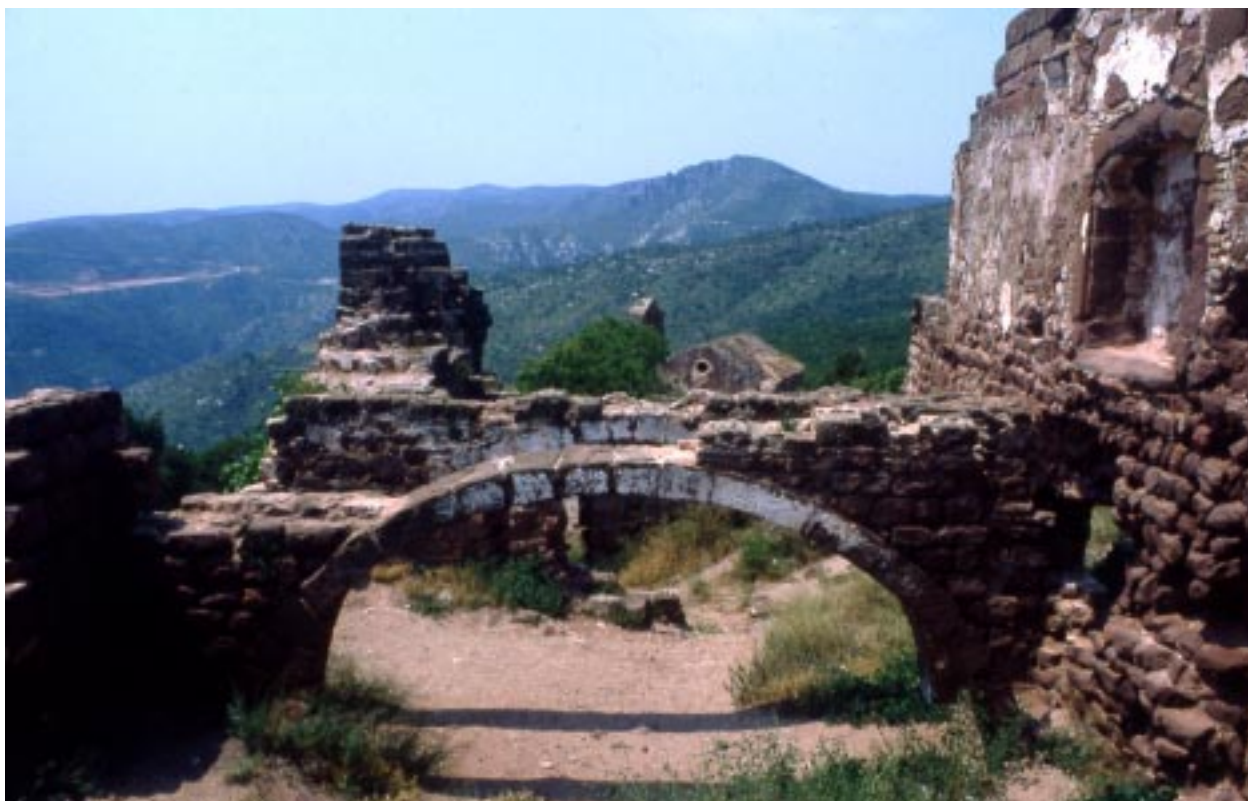
Panoràmica des del castell amb els arcs interiors, la capella de Sant Miquel i la muntanya de la Desfeta al fons