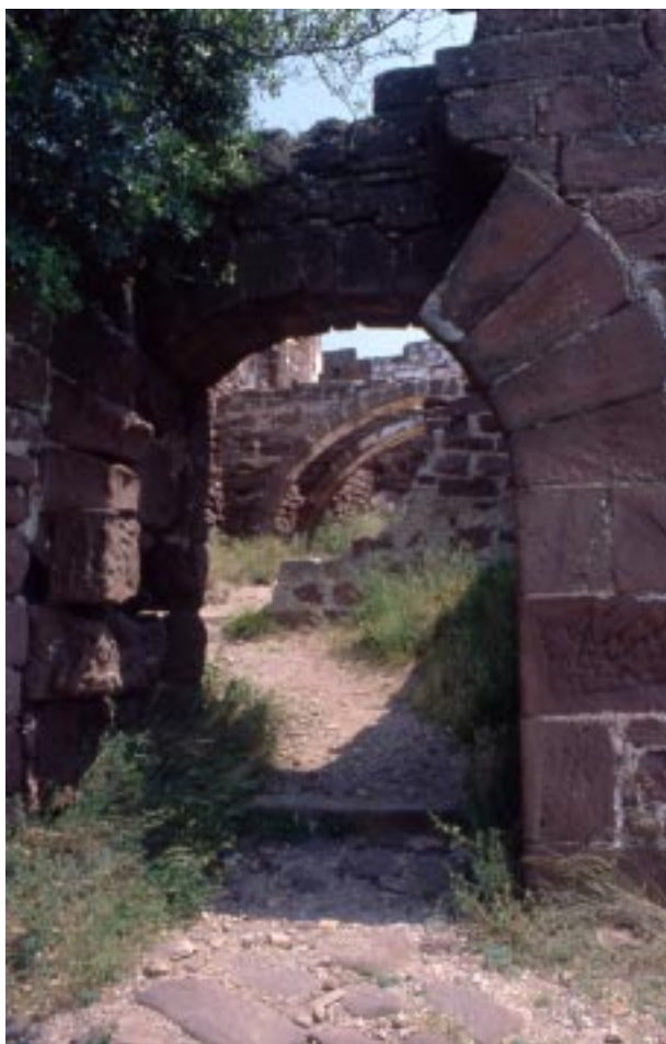
Interiors del castells