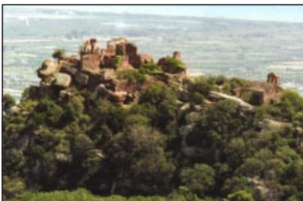
Visió aèria del castell

contra Ramon Berenguer I proclamant-se «príncep independent d'Olèrdola» i just després d'haver-li prestat jurament (1039). Finalment fou sotmès pel comte barceloní l'any 1059.