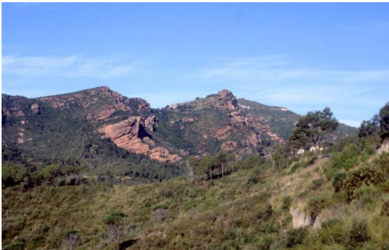
Castell d'Eramprunyà vist des de llevant