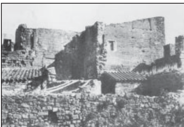
El castell tal com estava als anys 1920s.

El 1323, el rei Jaume II, que necessitava diners per a la conquesta de les illes de Sardenya