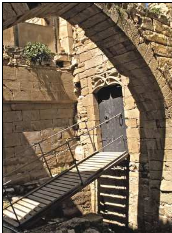
Porta d'accés sobre el fossat

El senyoriu de Ciutadilla estava vinculat al llinatge Guimerà. En la història de les nostres lletres, una senyora de Ciutadilla, Isabel de Guimerà, ha deixat un record interessant. Era aquesta dama filla de Berenguer de Relat,