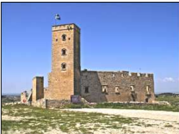
castell de Ciutadilla