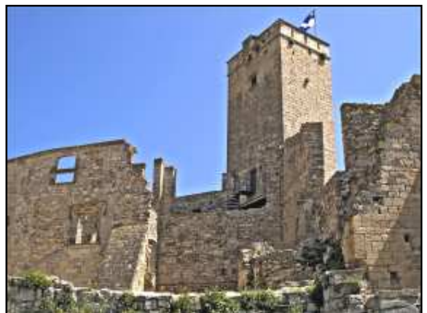
Interior del castell