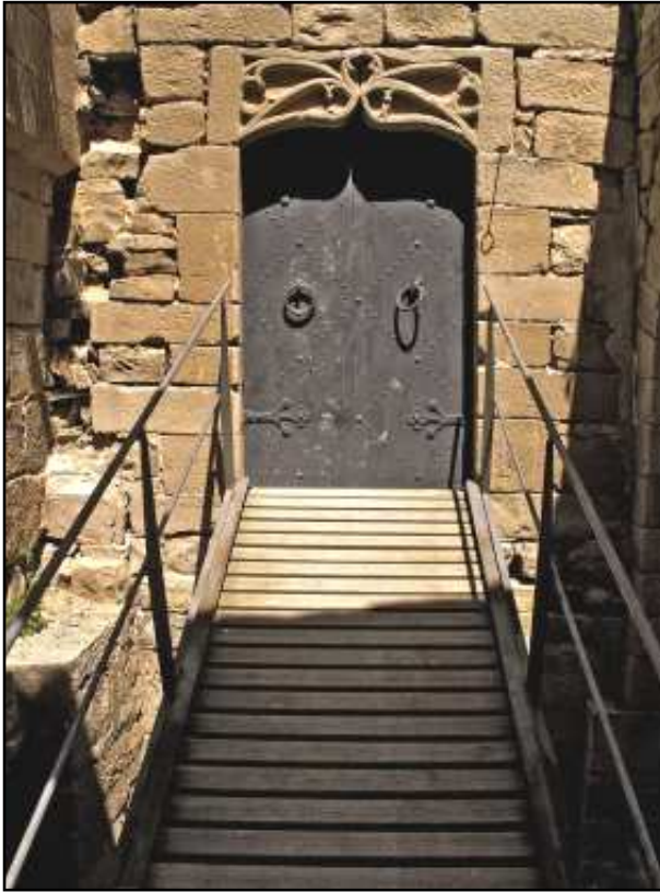
Portal d'accés i interior del castell

Al segle XVI, un altre Gispert de Guimerà, va convertir l'antiga fortalesa militar en un magnífic palau renaixentista. També s'aixecà aleshores la torre de l'homenatge, que dona fisonomia al castell i al poble, i entre els anys 1582 i 1587, fundaren el convent dominicà de la Mare de Déu del Roser a un quilòmetre al nord de la vila i que va subsistir fins l'any 1835.