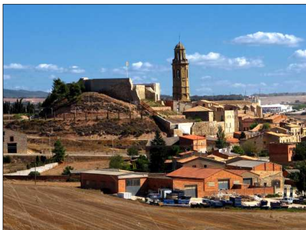
El castell situat damunt del poble de Calaf.

Nom del castell: Calaf Data de construcció: XII Municipi: Calaf Comarca: Anoia Altitud: 716 m Coordenades: E 376135 N 4621543 (Geogràfica - ETRS89) Com arribar-hi: situat a l'extrem oest del nucli urbà de Calaf.