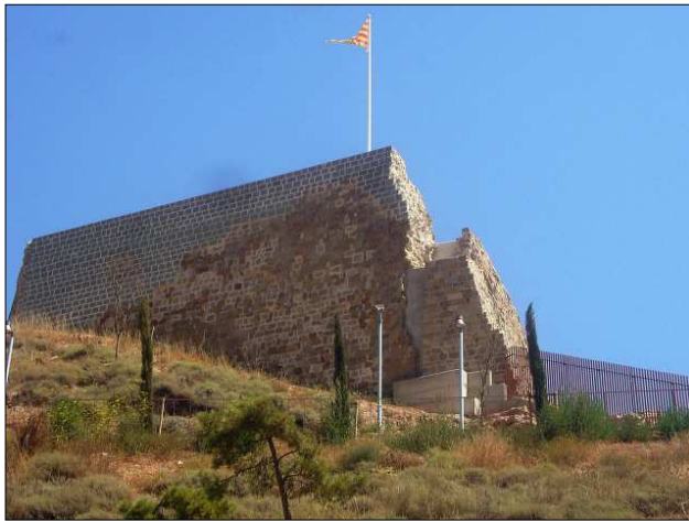
Muralla del castell de Calaf.

Abd al-Malik les quals afectaren greument tota la marca del comtat de Manresa, el comte Ramon Borrell i la comtessa Ermesenda, entre els anys 1010 i 1015 donaren al bisbe Borrell de Vic un territori de nom Segarra per a repoblar. L'any 1015 el bisbe donà al levita (amo de castell o castells en servei de l'Església) Guillem d'Oló, castellà de Mediona i Clariana aquesta marca de la Segarra en la qual hi havia els tres puigs de Calaf, Calafell i Ferrera. És desconegut l'activitat repobladora de Guillem d'Oló doncs no es tenen més notícies del castell fins al seu testament del 1031-33, en el qual el llegà a un fill clergue, que el tindria per l'església de Sant Pere de Vic.