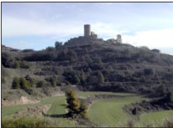
Castell de Boixadors vist des de ponent.

sud hi ha una finestra espitllurada, coronada, a l'exterior, per un bloc monolític i, a l'interior, per un arc de mig punt adovellat, on la finestra es fa més gran.