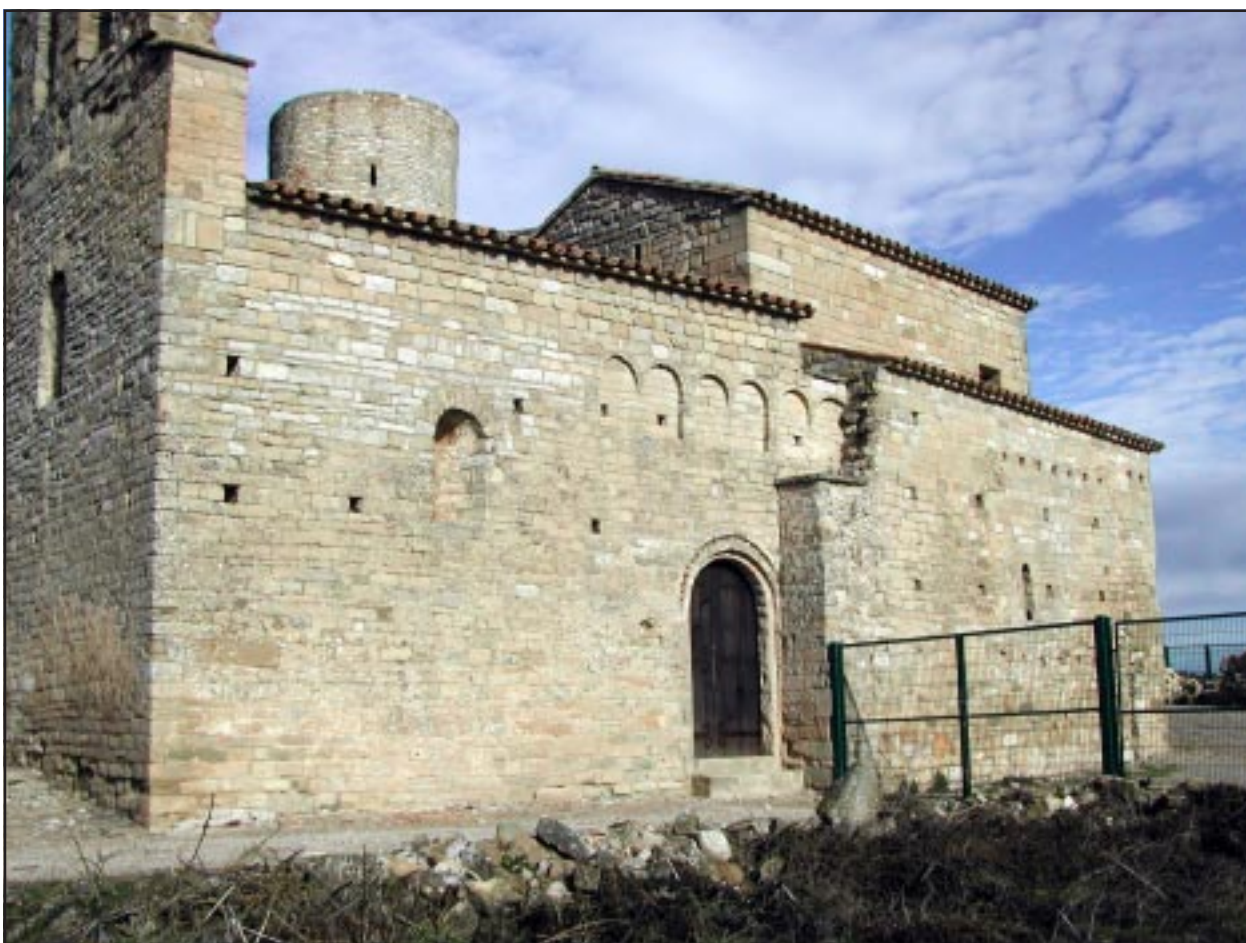
Església i castell des de llevant.

Edificat al s. XI, però transformat posteriorment, l'edifici es manté en un excel·lent estat de conservació. Originàriament devia tenir una nau, coberta amb volta de mig punt i reforçada amb arcs torals, que probablement acabava en un absis. A la fi del s.XIII es va ampliar la nau cap a l'est i es van edificar un absis quadrangular i dues capelles laterals, a manera de creuer. Més tard, es va sobrealçar la part primitiva de la nau, reforma que va conferir més harmonia al conjunt. Dues finestres il·luminen aquest sector originari, l'una al sud i l'altra a l'oest, la primera de doble esqueixada i coronada per un arc de mig punt adovellat; la segona és formada per un arc de mig punt adovellat que emmarca un petit desgruixament del mur, on s'obre pròpiament la finestra.