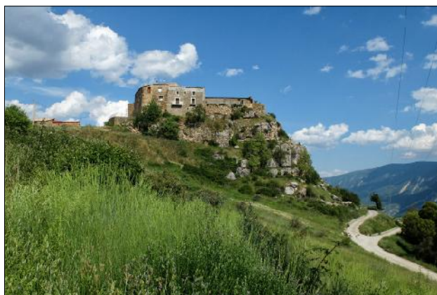
Castell de Moror.

Nom del castell: Moror Data de construcció: XI Municipi: Sant Esteve de la Sarga Comarca: Pallars Jussà Altitud: 853 m Coordenades: E 0.834502 N 42.078680 (Geogràfica - ETRS89) Com arribar-hi: entre els km 79 i 78 de la carretera C-13 entre Tremp i el pas de Terradets surt la carretera LV-9124 que arriba a Moror havent passat abans per Guàrdia de Tremp. Des de la C-13 fins a aquest nucli i castell hi ha 7 km.