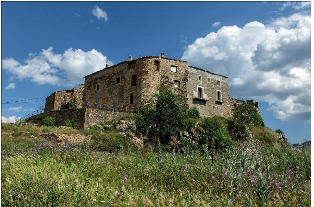
Castell de Moror.

corresponen a les muralles originals. El llenç s'acaba amb una torre d'angle, amb un fragment de circumferència visible de 5,5 m. Cap al sud hi ha encara uns 3 m més de muralla original. Aquesta muralla i la torre tenien una alçada d'uns 6 m. Els murs són formats per carreus de mida mitjana, col·locats en filades horitzontals.