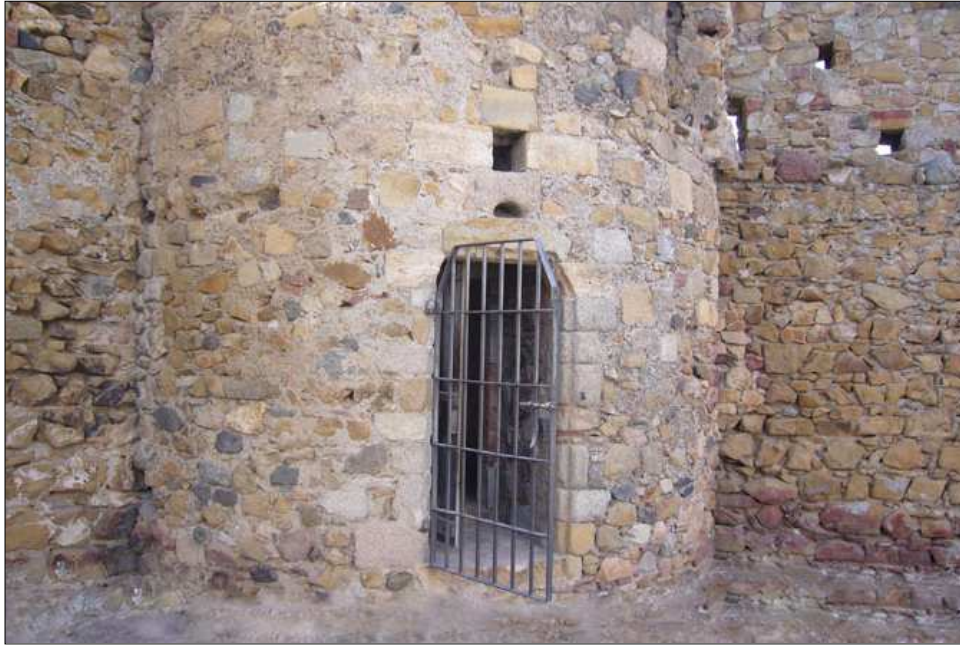
Torre de la Presó.

neixen l'anomenada torre de la Central, de planta circular de 5,90 de diàmetre i 10 metres d'alçada, i la torre Gemma, de planta quadrada, d'uns 4 metres de costat, 6 metres d'alçada i amb tres espitlleres. També existien diversos portals, dos d'ells ben coneguts: el d'en Saura, al sud, que estava flanquejat per dues torres, una enderrocada al segle XVII i l'altra a mitjan segle XIX, i el d'en Pi o d'en Nicolau, a l'est, també amb dues torres.