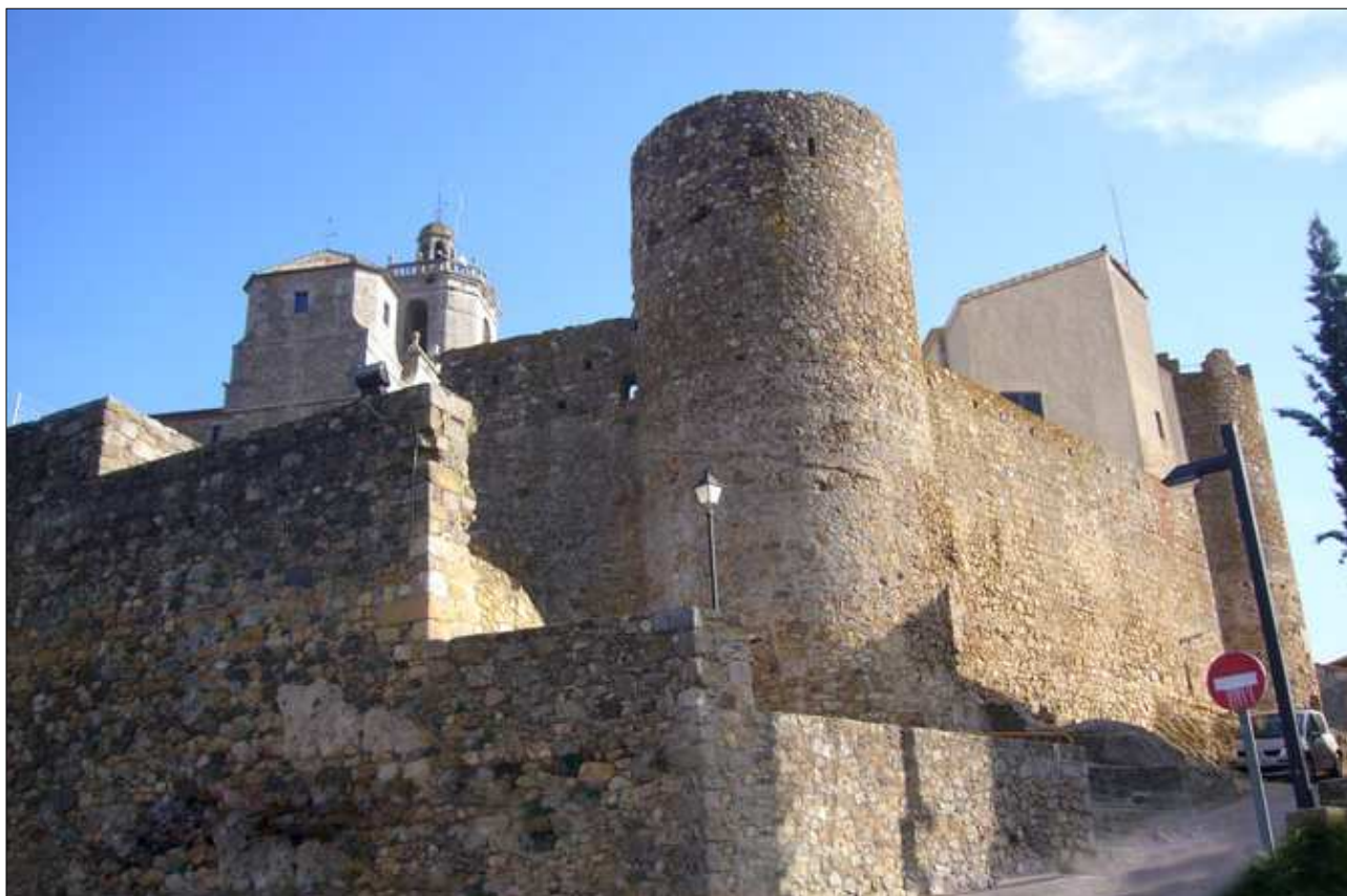
Imatge d'una de les torres i de muralla.