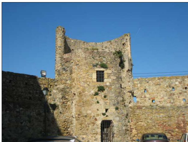
Torre de la Presó i segment de muralla.

Nom del castell: Llagostera Data de construcció: XII Municipi: Llagostera Comarca: Selva Altitud: 202 m Coordenades: E 2.891944 N 41.828889 (Geogràfica - ETRS89) Com arribar-hi: situat dins del mateix municipi.