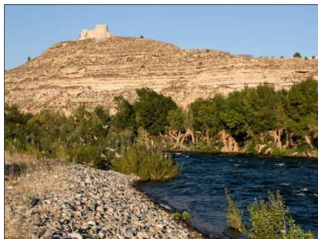
El castell amb l'Ebre als seus peus.