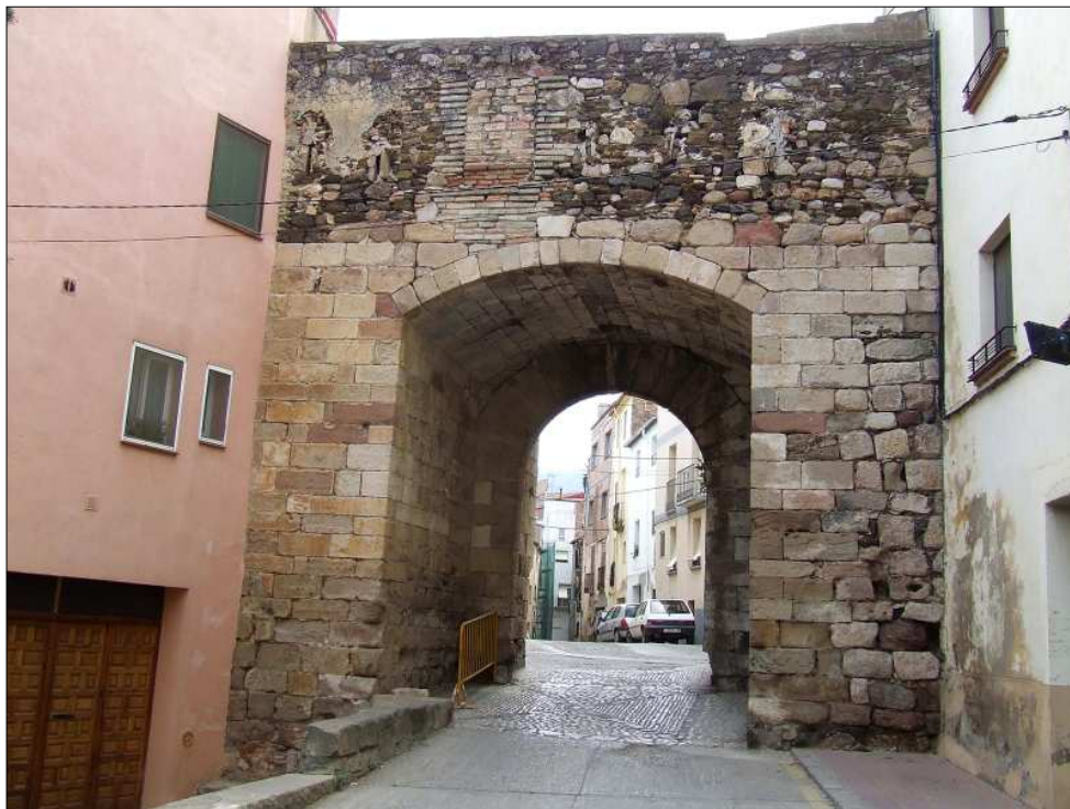
Portal del Bou

van cap a llevant. A més, sembla que hi devia haver un eix nord-sud que travessava la plaça de la Quartera, un dels centres més importants de Falset des dels darrers segles medievals, lloc on es devia celebrar el mercat. Es conserva un tram de muralla d'uns 200 m. connectat al castell, que passa pel portal del Bou, l'únic ben conservat dels cinc portals que s'obrien en les muralles (es conserven restes d'un altre portal dit dels Ferrers). Més a ponent, es troba l'anomenada plaça Vella. Com a hipòtesi de treball se suposa que la població es bastí en dues etapes. En època romànica, s'organitzà el sector occidental, proper al castell. Més tard, s'organitzà el sector oriental amb re-