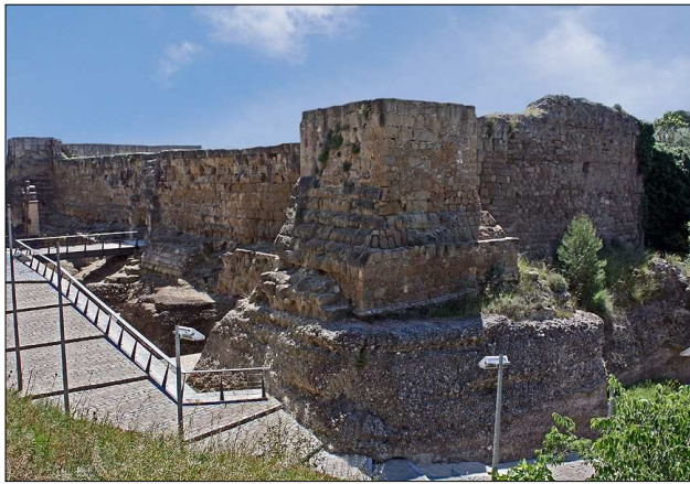
Interior del castell.

sortí vencedor (Setge de Balaguer (1280). El castell fou saquejat i destruït per les tropes reials el 1413, després de la victòria de Ferran d'Antequera en la revolta del darrer comte d'Urgell Jaume II el Dissortat. Les fortificacions —castell i muralla— es reforçaren en l'època de la guerra civil contra Joan II (1462-72) i en les guerres de Successió (1701–1714) i del Francès (1808–1814). Després d'aquestes conteses i de les guerres carlines (segle XIX), el castell quedà molt malmès.