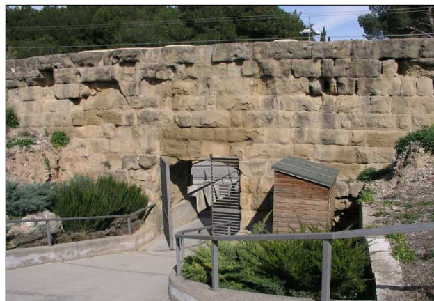
Muralla interior.

En la cara oest hi ha la torre núm. 7, de planta quasi quadrada, 3,50 m d'amplada per 3,70 m de fons que sobresurt uns 2 m del pany de muralla. És una torre pre-califal, de la qual es conserven 16 filades. Als extrems de la cara est hi ha les torres núm. 8 i 9. La torre núm. 8 es de planta rectangular, de 3,70 m d'ample per 2,50 de fons, d'una alçada aproximada d'uns 7 m, construïda amb carreus ben escairats lligat amb argamassa de guix. Es considera construïda o refeta el segle XI. La torre núm. 9 fou completament refeta l'any 1973 i era una torre de planta quadrada de 3,50 x 3,50 m que tenia 8 filades de carreus originals.