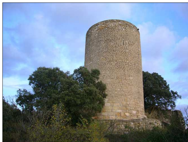
Castell de Cas.

Nom del castell: Cas o Torres de Cas Data de construcció: XI Municipi: Àger Comarca: Noguera Altitud: 901 m Coordenades: E 0.792952 N 41.969865 (Geogràfica - ETRS89) Com arribar-hi: el castell està situat a 4 km del port d'Àger seguint la pista que surt del mateix coll en direcció a llevant.