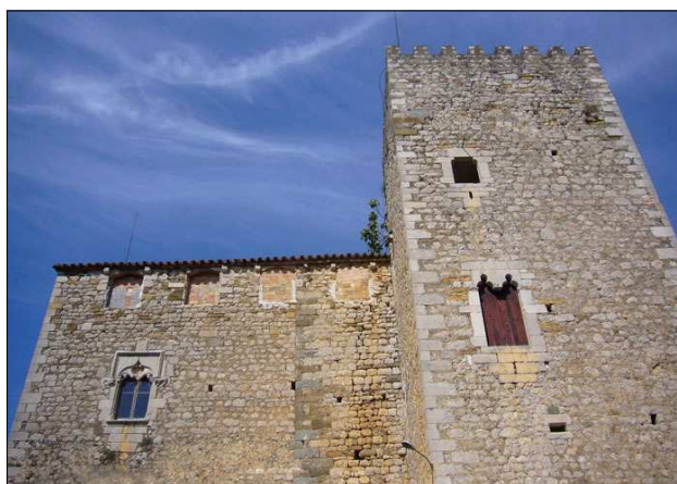
El castell del pla.