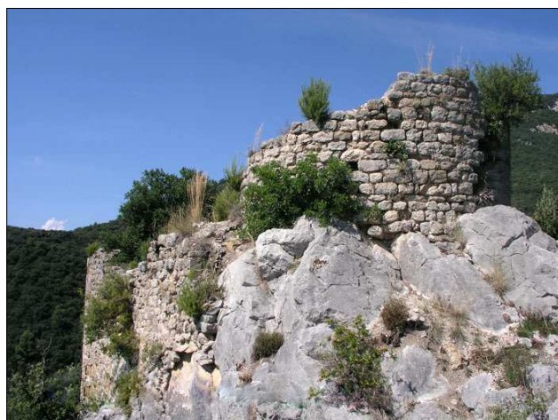
El Castellot amb els murs arran de la cinglera.

El castell de Beuda és documentat per primer cop el 1002, data en què el Papa Silvestre II va confirmar les possessions de l'església de Girona, entre les quals apareix: «... la sellam sancti Laurentii, quod est supra castrum Bobeta... ». Aquest docu-