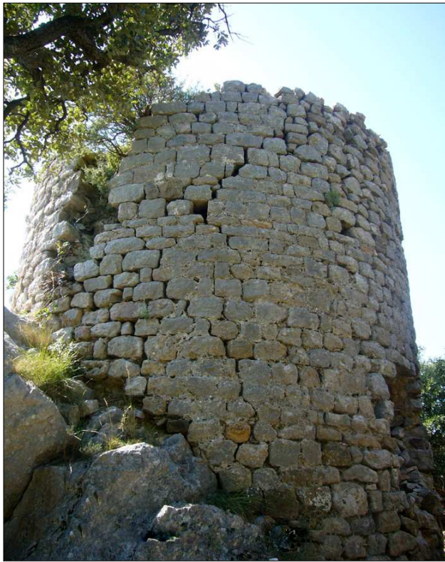
El Castellot amb la muntanya de la Mare de Déu del Mont al fons.