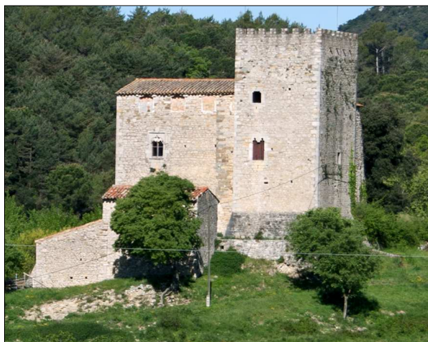
El castell del pla.

http://patmapa.gencat.cat/web/guest/patrimoni/arquitectura?articleId=HTTP://GAUDI_ELEMENTAR-QUITECTONIC_622