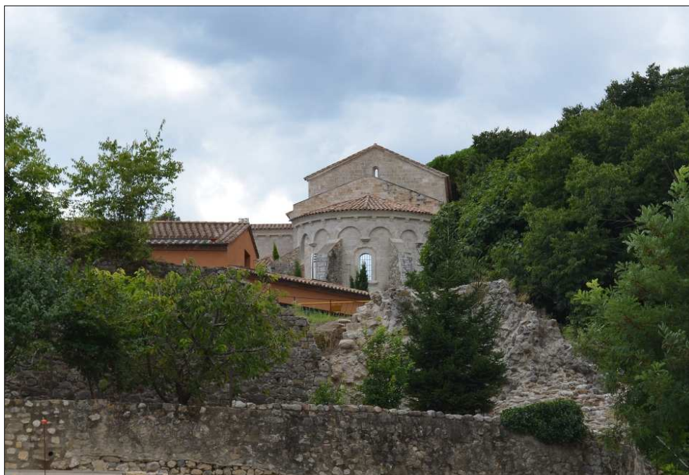
Restes del castell i absis de Santa Maria.

En època del comte Bernat Tallaferro, s'hi feren diversos judicis. Per exemple, l'any 1003 hi ha