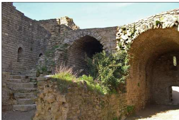
Restes del castell d'Àger.

Les restes del castell d'Àger, juntament amb la canònica de Sant Pere, es troben dalt del turó que domina la vila. Els barris de Sant Pere, Sant Martí, Solsdevila i el carrer del Pedró, distribuïts esglaonadament sota el castell, eren dins el recinte murallat. Fora muralles se situaven els ravals de Sant Martí i del Pedró.