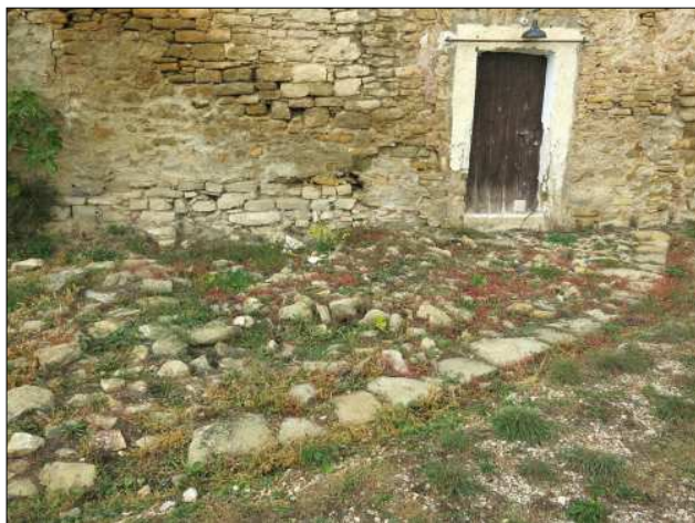
Imatge presa l'octubre de 2015 d'una part de la base de la gran torre medieval del castell d'Àger.

l'espai ocupat pel castell. Així, tocant al claustres hi ha vestigis de possibles construccions relacionades amb la fortalesa, potser fins i tot anteriors a les restes del castell palau.