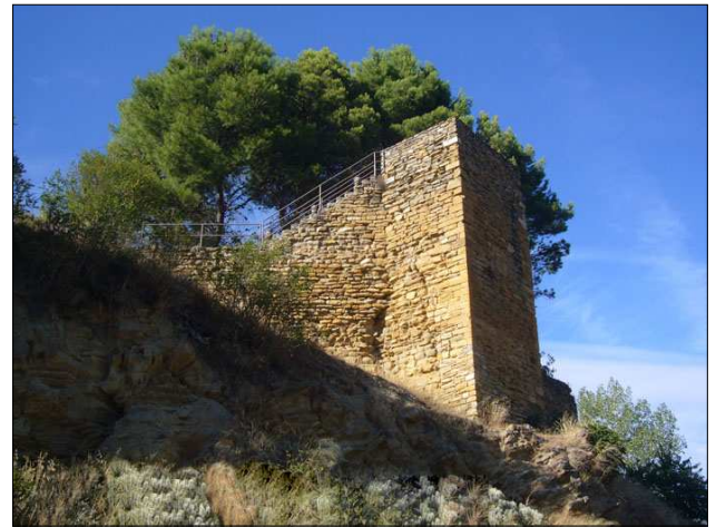
Muralles d'Àger.

Les restes conservades són escasses si es té present la importància que devia tenir aquesta construcció, situada dins el recinte sobirà de les muralles d'Àger, al costat de la canònica. L'element essencial del castell devia ser una gran sala o castell palau residencial dels vescomtes. Del castell resta una part de la planta baixa d'un gran edifici rectangular distribuït en dues naus paral·leles situades a un nivell inferior al terra de l'església. A sobre d'aquestes naus, probablement hi hauria la sala major del castell-palau, tal com trobem en d'altres exemples de l'època, com el castell de