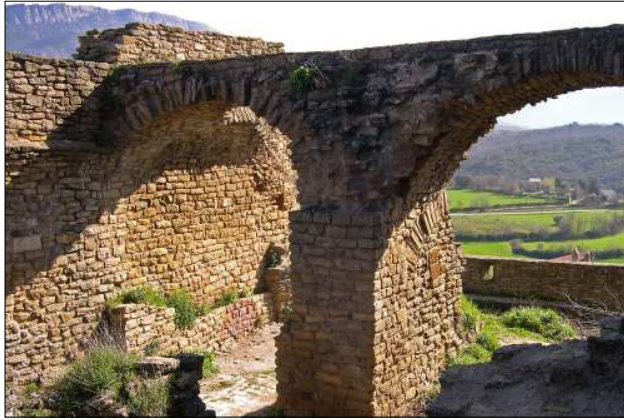
Restes del castell d'Àger.

Durant la guerra dels Segadors (1640-1652), Àger lluitava contra el rei d'Espanya, Felip IV. El 1644, el castell va ser conquerit per les tropes del rei després d'una vigorosa defensa i quan portaven tan temps sota setge que ja no els quedaven aliments. L'any següent es van rebel·lar però l'octubre de 1646, la vila d'Àger tornava ser sota domini espanyol, després d'haver-se conquerit el castell d'Àger. Es va alliberar novament però el 1652 va tornar a ser reduït per la força, ja de forma definitiva.