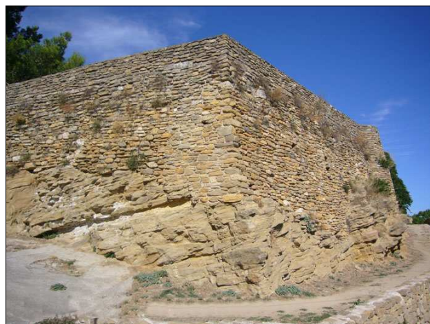
Murallat d'Àger.

La vall i el castell d'Àger foren conquerits per Arnau Mir de Tost a la primera meitat del segle XI. La documentació fa referència a la fortalesa i el seu terme castral. El castell és documentat des de l'any 1034, en poder d'Arnau Mir de Tost. El 1046 fou conquerit de nou pels musulmans i el 1048 reconquerit definitivament per Arnau Mir. En una donació de certs alous per part d'Arnau Mir a Ollemer i Xeno l'any 1038 es precisa que són «in kastrum de Ager» i es donen les afrontacions de terme del castell: « de parte orientis in Noguera, de meridie in sera de Nor, de occiduo in Nogerola, a parte vero circii in sera de Ares »,